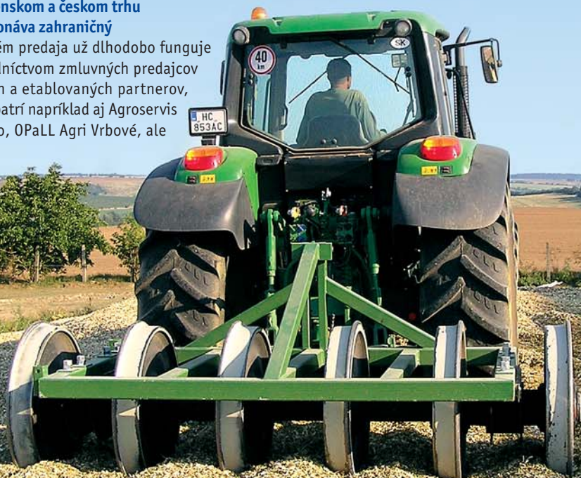
Utláčač silážovaných krmív sa vyrába so záberom 3 m s hmotnosťou 2 400 a 3 800 kg.

K zákazníkom a užívateľom sejacích strojov Pneusej patria vzhľadom na šírku záberov menší poľnohospodári, či už u nás alebo v zahraničí, s menšími výmerami a menšími traktormi. Univerzálnosť pre použitie v rôznych typoch a druhoch pôd je daná výberom jedných z troch typov výsevných pätičiek. Najjednoduchšia, najľahšia a najlacnejšia je nožová výsevná päťka s tupým