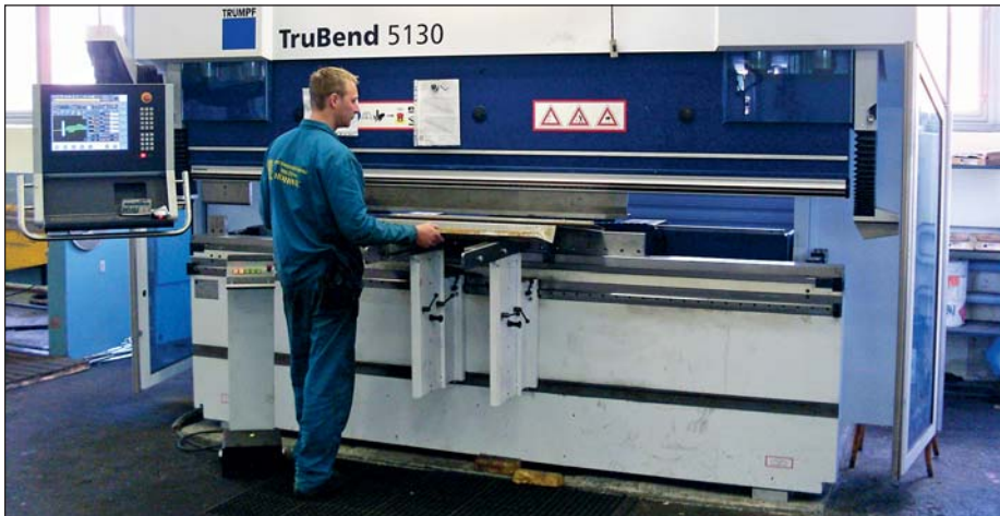
V PD Hlohovec disponujú najmodernejšími strojmi v oblasti obrábania strojov. CNC ohraňovací lis značky Trumpf má silu 130 ton na dĺžku 3 230 mm.