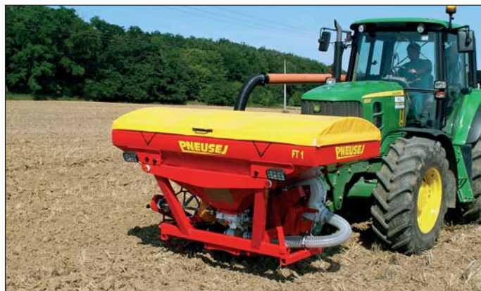
Novinka z portfólia PD Hlohovec nesie označenie MKC. Umiestnením zásobníka nad rotačné brány bližšie k traktoru sa znížila potreba zdvižnej sily.