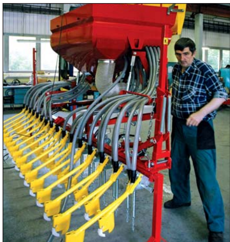
PD Hlohovec patrí k mála podnikom na Slovensku vyrábajúcim poľnohospodárske stroje.

Moderná mechanizácia v poľnohospodárstve